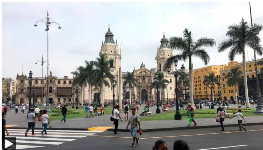
Folge 231: Große Gefühle in Ecuador | Video verfügbar bis 25.01.2018